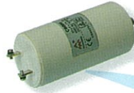
คอนเดนเซอร์ @ 400