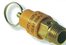
วาล์วป้องกัน @ 160.-