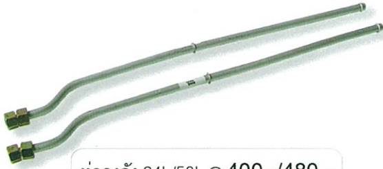
ท่อลงถัง 24L/50L @ 400.-/480.-