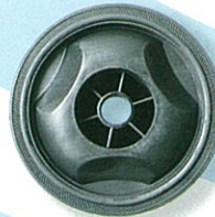
ล้อ 5" @ 120.-