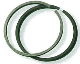
แหวนลูกสูบ @ 160.-