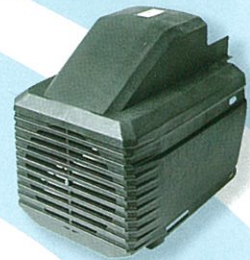
พลาสติกครอบปั๊ม @ 300.-