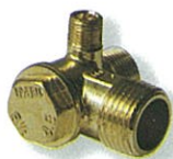
เช็ควาล์ว @ 200.-