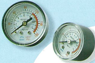
เกจวัดลม (ใหญ่) / เกจแบ่งลม (เล็ก) @ 400.-