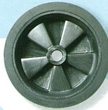
ล้อ 6" @ 200.-