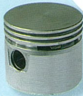
ลูกสูบ @ 160.-