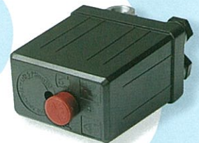
เพรชเซอร์สวิทช์ @ 600.-