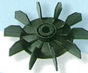
ใบพัดมอเตอร์ @ 100.-