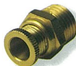
วาล์วถ่ายน้ำ @ 120.-